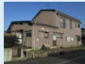
張替え後のイメージ